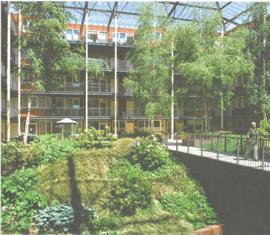
Binnentuin bij Maison St. Cyr in Geldrop (Woningcorporatie Wooninc)