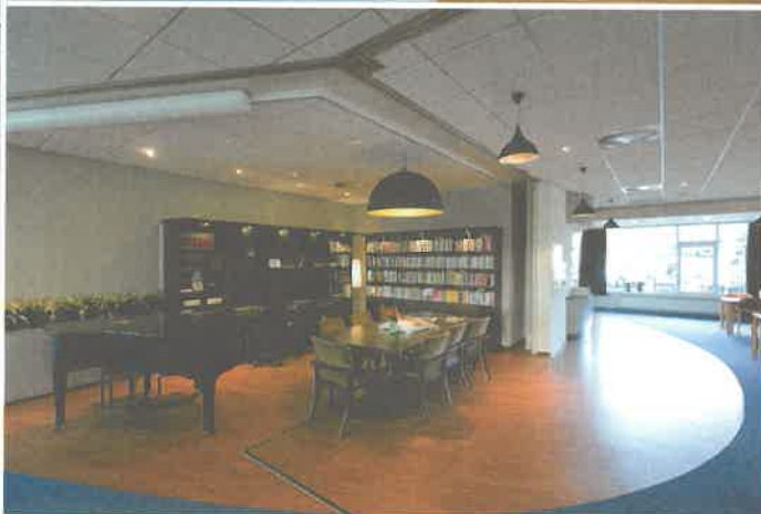
Vivium Godelinde in Bussum